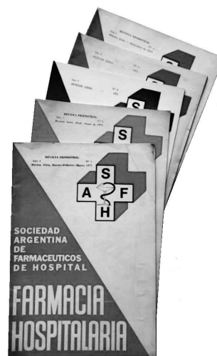
Figura 1. Primer ejemplar de la revista Farmacia Hospitalaria y números siguientes